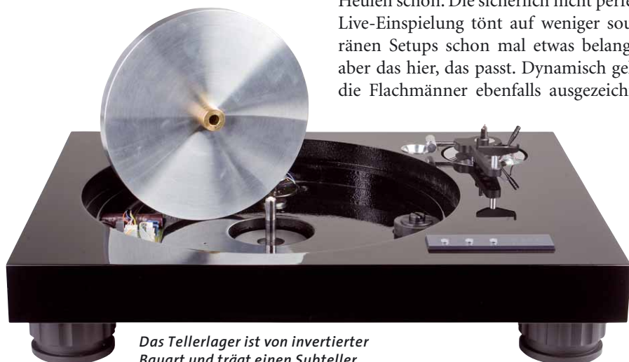
Das Tellerlager ist von invertierter Bauart und trägt einen Subteller