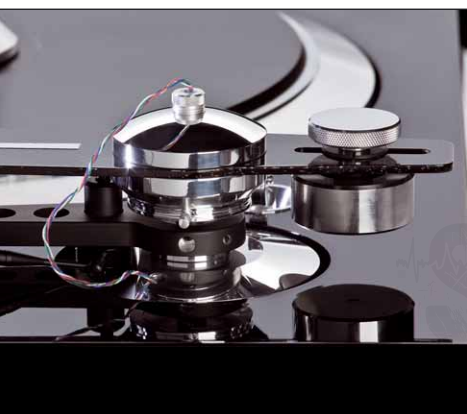
Das Gegengewicht ist in einem Schlitz im Tonarm verschiebbar