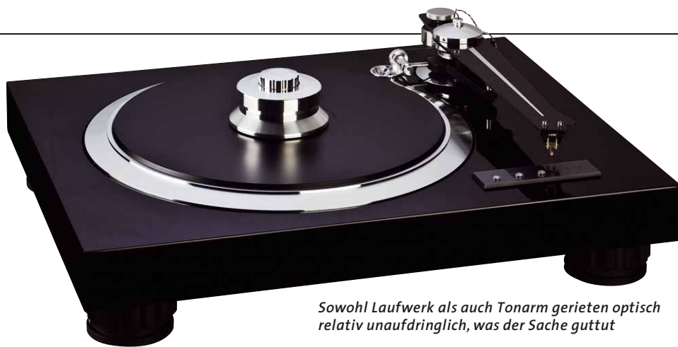
Sowohl Laufwerk als auch Tonarm gerieten optisch relativ unaufdringlich, was der Sache guttut

taster praxistauglicher sein und liegt im mittelschweren Bereich.