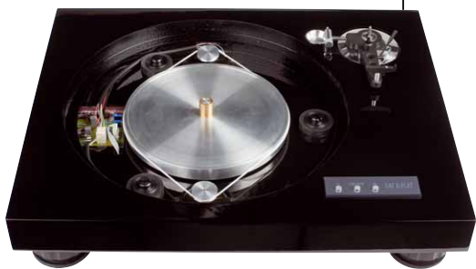
Den Antrieb übernehmen zwei unter dem Teller angeordnete Motoren